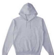
04 ASH アッシュ (S~XXXLサイズのみ)