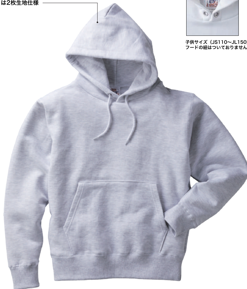
04 ASH アッシュ