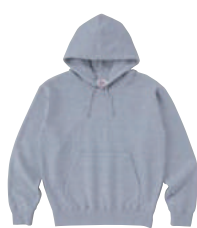
05 HGY ヘザーグレー