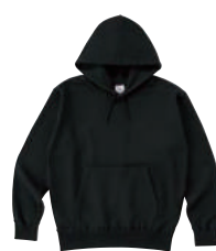
09 SBK ブラック