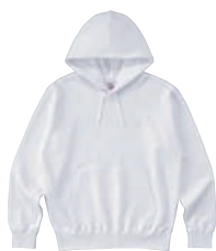
01 WHT ホワイト