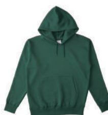
52 IVG アイビーグリーン (S~XXXLサイズのみ)