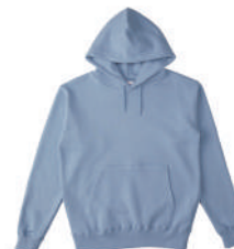
57 ABL アシッドブルー (S~XXXLサイズのみ)