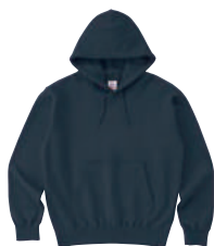
69 Nvy ネイビー