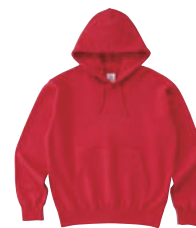
46 SRD スーパーレッド