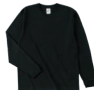
09 SBK ブラック