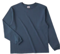
68 DNM デニム