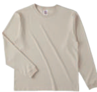
14 STN ストーン