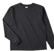
77 SKR スミクロ