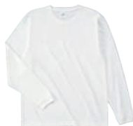
01 WHT ホワイト