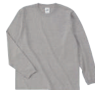
05 HGY ヘザーグレー