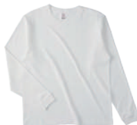
02 NTR ナチュラル