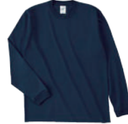
69 Nvy ネイビー