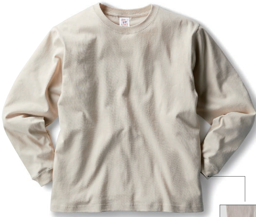
14 STN ストーン