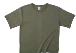
80 AGR アーミーグリーン