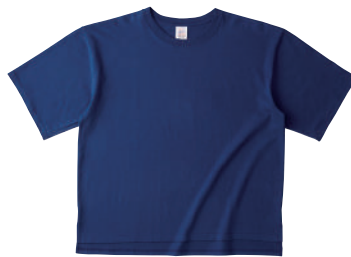
19 DBL Dブルー