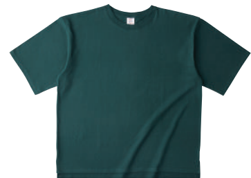
27 DGR Dグリーン