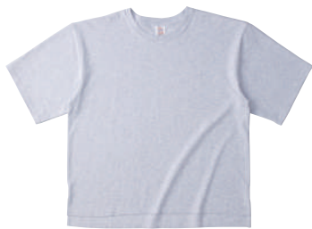
04 ASH アッシュ