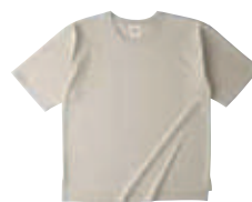
14 STN ストーン