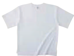
01 WHT ホワイト