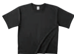
03 DBK ディープブラック