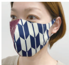
女性 M サイズ着用