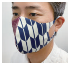
男性 L サイズ着用