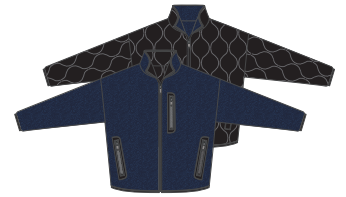
03 ネイビー×ブラック