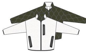
60 アイボリー×カーキ